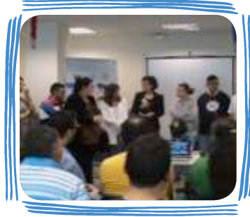
PREMIOS POR OBJETIVOS Y GRUPOS DE MEJORA (2 premios al año)