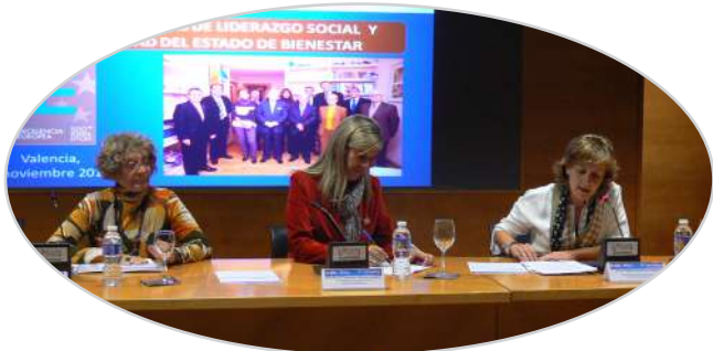
IV Jornada de liderazgo y participación de mayores en Valencia (2014).