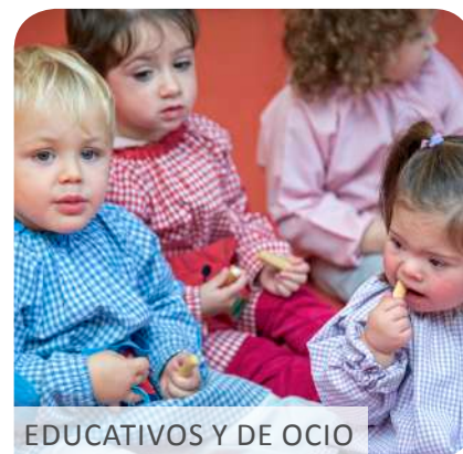
EDUCATIVOS Y DE OCIO