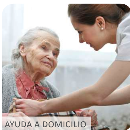
AYUDA A DOMICILIO