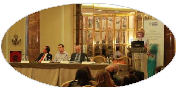
II Jornada de esterilización de EULEN Sociosanitarios en Madrid (2014).