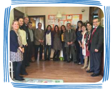
PREMIOS DE INNOVACIÓN Y BUENAS PRÁCTICAS (1 premio al año)

“En total han sido premiados, en el año, más de 100 profesionales de EULEN Sociosanitarios”