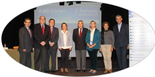
I Jornada de liderazgo y participación de mayores en Zaragoza (2013) .