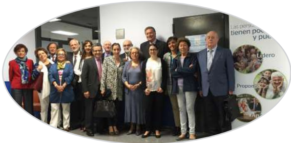
II Jornada LideA de visualización positiva y liderazgo de las personas mayores. Madrid, 2016.

"En 4 años, 7 jornadas con la participación de más de 600 personas".