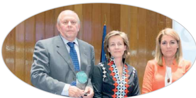
I Premio de liderazgo de personas mayores EULEN-SENDA a CEATE (2014).