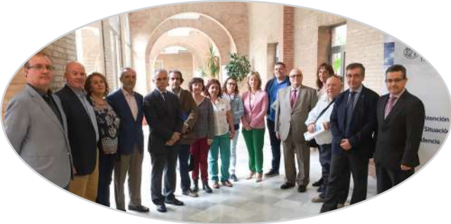
VII Jornada de liderazgo de personas mayores en Sevilla (2016).