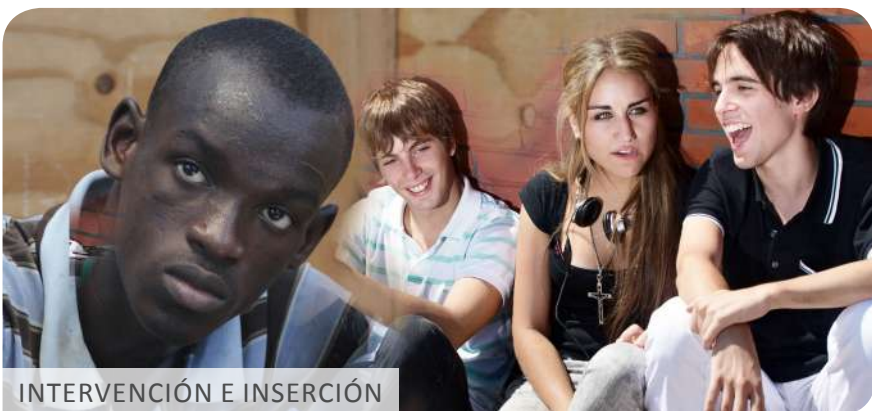
INTERVENCIÓN E INSERCIÓN