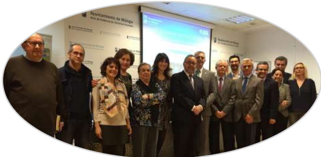
VI Jornada de liderazgo y participación de mayores en Málaga (2016).