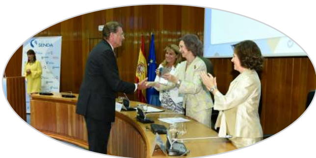
II Premio de liderazgo de personas mayores EULEN-SENDA a CAUMAS (2015).