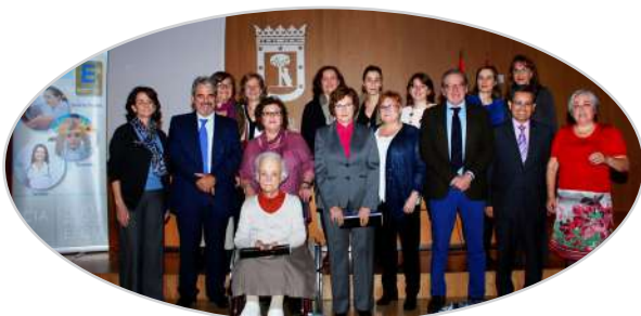
V Jornada de Servicios Sociales Comunitarios en Madrid (2015).