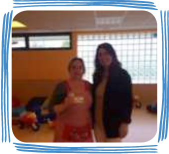
PREMIOS POR FELICITACIONES (7 premios al año)

Contamos con un sistema de premios , que tiene las siguientes categorías: