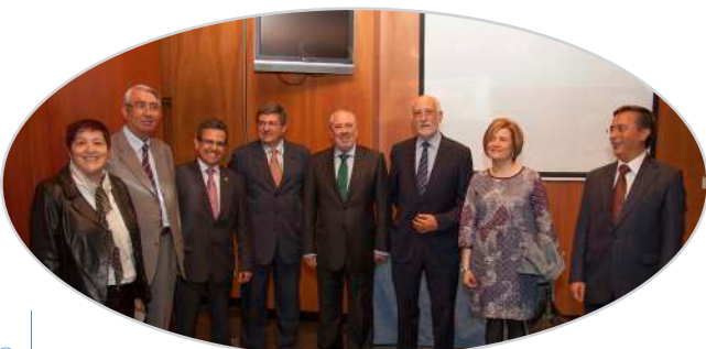
III Jornada de liderazgo y participación de mayores en Logroño (2014).