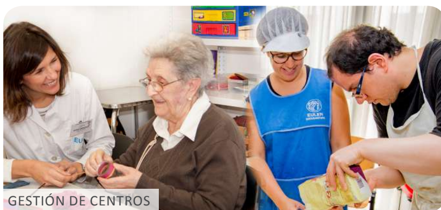
GESTIÓN DE CENTROS