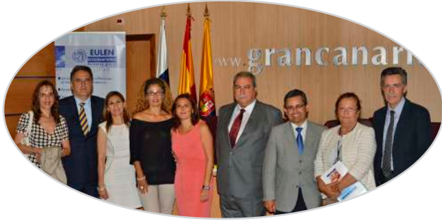
II Jornada de liderazgo y participación de mayores en Las Palmas de Gran Canaria (2013).